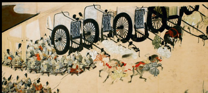
平治物語絵巻 六波羅行幸の巻 今村随学筆 江戸時代 天明元年(1781)

馬は古代より人の生活と文化に深く関わり、中世からの武家社会ではとくに軍馬として重用されました。軍事権を「兵馬の権」・武芸一般を「弓馬の道」と言うように、馬を扱うことは武士の必須の嗜みであり、優れた馬は、武威・武芸の象徴として武士の身分格式を示す存在となりました。こうして武家風俗と密接に結びついた馬は、その気高い姿が武士たちに愛好され、多様な美術工芸品のモチーフにも表されます。また、人馬を繋ぐ馬具は時代や用途によって変化し、近世には華やかな装飾性が取り入れられて発展しました。本展では、馬と人がともに生きた歴史について、武家社会と馬の関わりを中心に紐解いていきます。