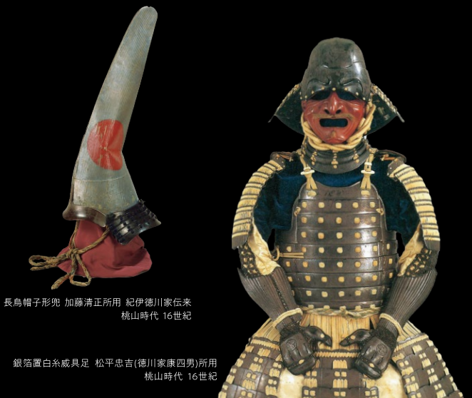
長鳥帽子形兜 加藤清正所用 紀伊徳川家伝来 桃山時代 16世紀