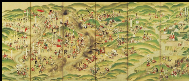
長篠合戦図屏風 六曲一隻 江戸時代 18~19世紀 (展示: 8/14~9/16)

[表紙の作品]・朱塗啄木糸威具足 徳川義直(尾張家初代)所用 江戸時代 17世紀・黒塗桐紋鞍・鎧 伊勢駿河守貞雅作 徳川家康所用 桃山~江戸時代 16~17世紀・作品は全て徳川美術館蔵