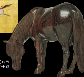
紫檀製「翁澤」置物 伊勢貞門作 徳川慶勝(尾張家14代)所用 江戸時代 19世紀