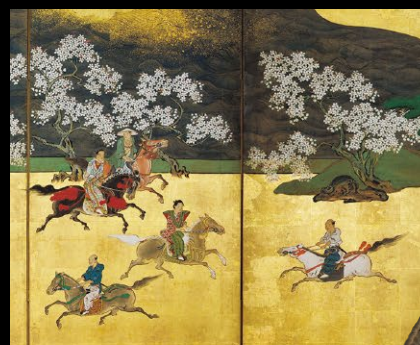
調馬図屏風 六曲一双 尾張徳川家伝来 岡谷家寄贈 江戸時代 17世紀 (展示: 右隻7/27~8/13・左隻8/14~9/16)