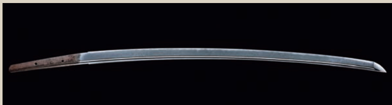
重要文化財 刀 無銘 正宗 鎌倉時代 14世紀 徳川美術館蔵

武蔵野美術大学入学後、鈴木敬三氏の有職故実に出会い歴史考証の世界で生きていく事を決意。朝日新聞出版、毎日新聞、学習研究社、NHK放送局などで歴史再現イラストを制作。