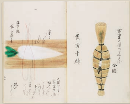
宮重大根「礼物軌式」のうち 江戸時代 文化13年(1816)序 徳川林政史研究所蔵

徳川美術館の姉妹機関である徳川林政史研究所(東京都豊島区)では木曾山を中心とした「林政史」研究だけではなく、江戸時代の「幕政史」や尾張「藩政史」も主要テーマとして研究を進めてきました。本展では、その成果を、研究所所蔵文書や徳川将軍家伝来文書を中心に紹介します。将軍家と尾張家との関係性に着目しながら、絵図や文書などの歴史史料に基づいて、江戸城や名古屋城における将軍・藩主の公務の実態を、イラスト等を用いてわかりやすく展示します。