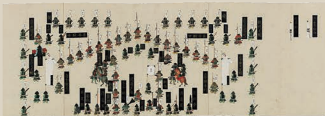
陣備図 大御先鋒日之丸御備(六)部分 江戸時代 18-19世紀 徳川林政史研究所蔵