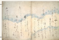
重要文化財 重之集 伝藤原行成筆