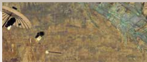
蓬生 平安時代 12世紀 9/22 ~ 10/6