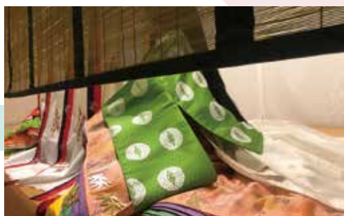
復元装束による打出の再現 協力:一般財団法人民族衣裳文化普及協会

【国宝】宇治香箱 靈仙院千代姫(尾張家2代光友)所用 江戸時代 寛永16年(1639)