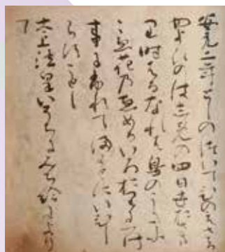
重要文化財 安元御賀記 藤原定家筆 鎌倉時代 13世紀

本展では、平安時代以降も長きにわたり宮廷の人々を中心となって作り上げ、伝え続けてきた華やかな文化について紹介します。