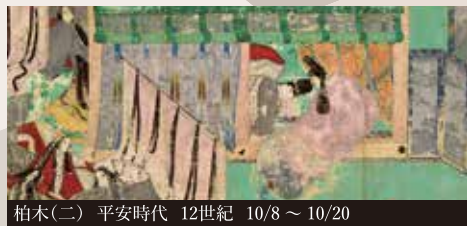
柏木(二) 平安時代 12世紀 10/8 ~ 10/20