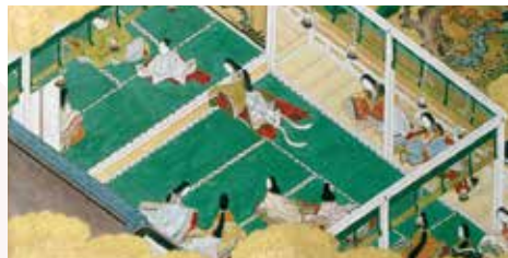
源氏物語絵巻 桐壺 絵:市川光重筆 3巻の内(展示場面は半期で巻替) 江戸時代 明暦元年(1655) 個人蔵