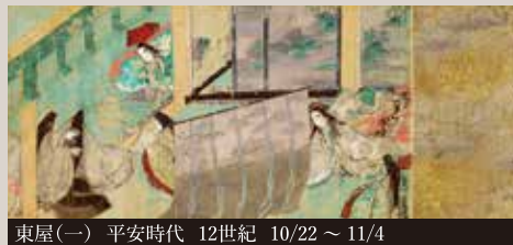
東屋(一) 平安時代 12世紀 10/22 ~ 11/4